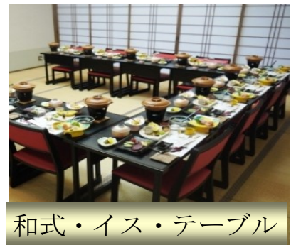
和式・イス・テーブル